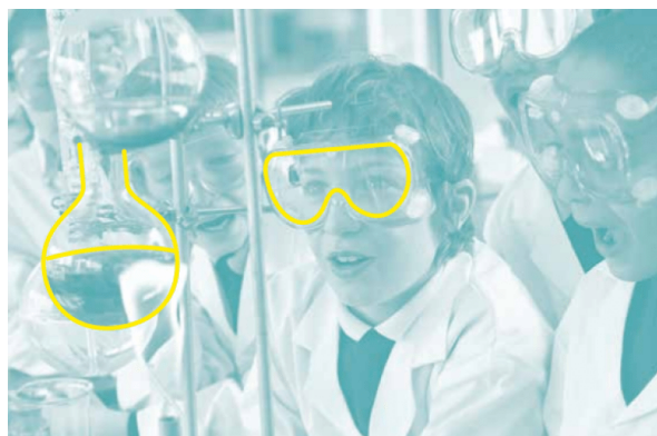
Figure 1 - Elèves en TP de chimie