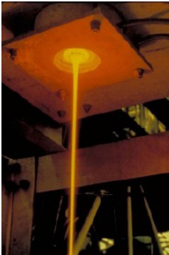
Figure 5 - Produits de fission vitrifiés (déchet HAVL).

combustibles irradiés, c'est-à-dire que les différents radionucléides, produits de fission et transuraniens, sont transformés en oxydes par calcination puis mélangés à du verre en fusion et coulés (figure 5) dans un conteneur en acier inoxydable. Après refroidissement, ils constituent des blocs inaltérables : les colis standard de déchets vitrifiés (CSD-V). Ces objets se présentent sous la forme de cylindre de 43 cm de diamètre et de 1,3 m de hauteur ; leur volume externe est de 180 L et ils contiennent environ 160 L de verre pour une masse de 400 kg. Ces déchets sont entreposés à La Hague (et à Marcoule pour les productions antérieures). Ils relèvent eux aussi, bien sûr, de la loi de 1991.