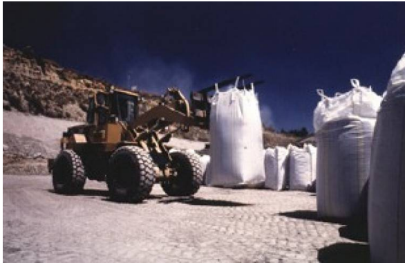
Figure 2 - Gravats de démantèlement (déchets TFA).