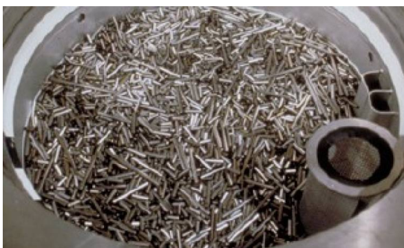
Figure 4 - Débris de gaine de combustible (déchets MAVL).

Ce sont des déchets contaminés par des radionucléides et dont la quantité de radionucléides de longue période (transuraniens) est trop importante pour satisfaire les conditions d'admission en stockage de surface comme déchets A. Ils sont produits principalement au cours du traitement des combustibles usés (CU) à La Hague et, dans une moindre mesure, par le CEA, à l'occasion de ses activités de recherche en énergie ou de production d'armes nucléaires. Ces déchets sont entreposés par leurs producteurs (COGEMA et CEA) et relèvent de la loi de 1991. Les déchets B issus du traitement des CU comprennent notamment les structures métalliques des combustibles (tronçons de gaines en alliage de zirconium, appelées coques (figure 4), et différentes pièces en acier), et des déchets - métalliques ou non - de maintenance des installations. Ceux-ci sont puissamment compactés et enfermés dans des conteneurs en acier inoxydable pour former les colis CSD-C (« colis standard de déchets compactés »), de même géométrie que les colis de déchets vitrifiés (CSD-V, voir ci-après). L'entretien des installations produit également les déchets métalliques de grande taille : pompes, vannes..., non compactables, qui sont cimentés et conditionnés dans des colis en béton. Le CEA et la COGEMA ont également produit dans le passé des boues de traitement d'effluents liquides, conditionnées dans du bitume, relevant de cette catégorie de déchets.