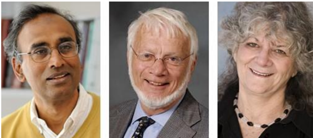
Figure 1. Venkatraman Ramakrishnan, Thomas A. Steitz et Ada E. Yonath : lauréats du Prix Nobel de Chimie 2009

Les ribosomes produisent les protéines qui, à leur tour, contrôlent la chimie de tous les organismes vivants. Les ribosomes étant cruciaux à la vie, ils sont aussi une cible majeure des nouveaux antibiotiques.