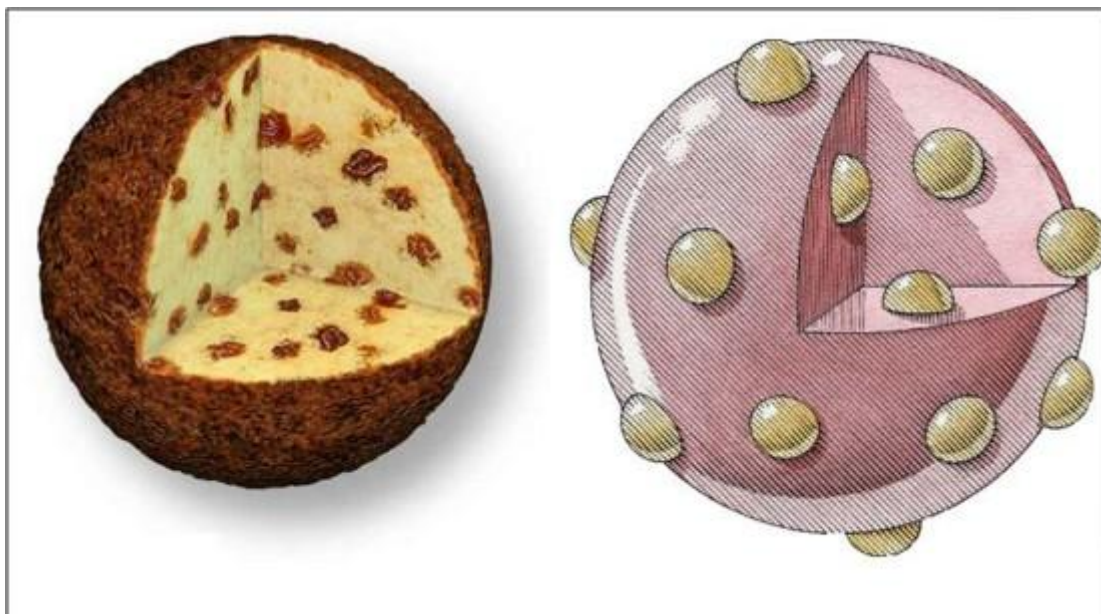
Figure 1. Schématisation du plum-pudding

J.J. Thomson entrevoit ainsi la notion d'atomes sécables. Pour respecter la vision classique de la matière continue, il propose le modèle du "plum-pudding".