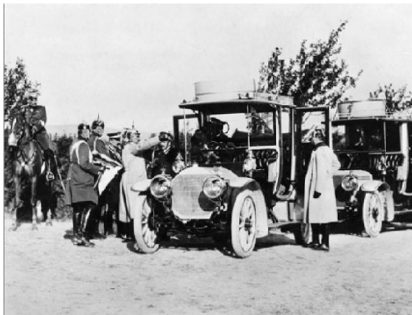
Figure 3 - L'empereur Guillaume II et ses nouveaux pneus.

pneumatiques de voiture à partir de ce nouveau matériau. Carl Duisberg, le patron d'Hofmann, parcourut 4 000 km « sans crevaisson » dans un véhicule chaussé de pneumatiques en élastomère synthétique et même l'empereur allemand était « plus que satisfait » des pneumatiques du même type qu'il avait fait monter sur sa voiture personnelle (figure 3).