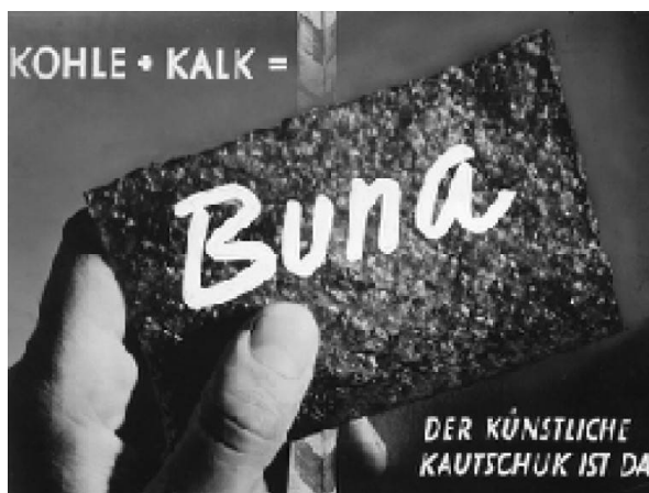
Figure 4 - Le caoutchouc Buna !

Le caoutchouc synthétique a vu son importance croître encore quand les chercheurs, utilisant du sodium, sont parvenus à réaliser une polymérisation plus rapide et plus performante des composants du caoutchouc comme le méthylisoprène d'Hofmann. Dans les années 20 du siècle dernier, le sodium et les innombrables astuces utilisées par les successeurs d'Hofmann ont même permis de produire une autre gomme synthétique à base de butadiène, un parent chimiquement proche, mais « plus simple », de l'isoprène, le composant de base du caoutchouc naturel. Ce nouveau matériau allait devenir légendaire sous le nom de « Buna » (pour B utadien et N atrium, « sodium » en allemand).